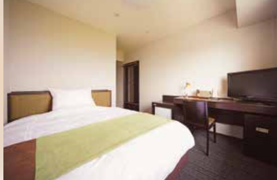
デラックスシングル(ダブル)ルーム 幅152cmの大型ベッドを標準装備。 ダブルルームとしても利用可能です。

ホテルに入ると広がるやさしい雰囲気。 細やかな心配りに癒されるひととき。 お客さまにいつでもYesとお応えしたい… そんな気持ちでお迎えいたします。