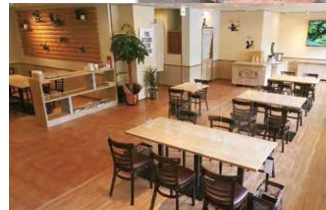
みなとキッチン(朝食会場)