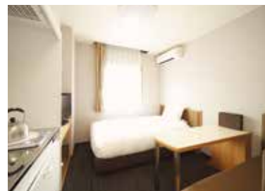
ロングステイシングルルーム ミニキッチン&大型冷蔵庫&オープン電子レンジ& 食器類を完備。大きめのクローゼット、テーブルや 作業台も便利です。