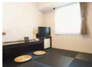
エコノミー和室 畳にごろりと横になれる清潔空間。 ふるさとに「おかえりなさい」といった イメージでお寛ぎいただけます。