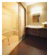
バリアフリー ツインルーム 段差をなくし、あらゆる 開口を広く取った贅沢な お部屋。全てのお客様に やさしい、使い勝手の良 さを感じて下さい。