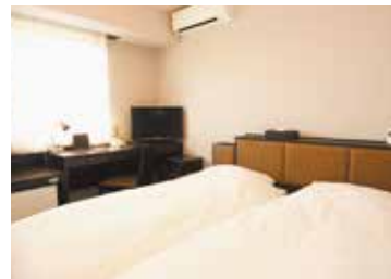
エコノミーツインルーム ツインルームをリーズナブルにご利用ください。 カップルや、小さなお子様連れのファミリールーム としておすすめです。