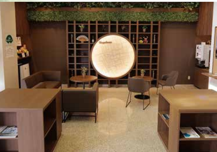
ロビー・ラウンジ