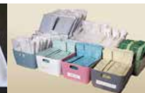
アメニティバイキング