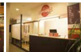
リラクゼーションコーナー 「ホットハンズ」