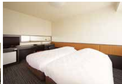
ツインルーム セミダブルベッドが2台。ハリウッドツインスタイル。