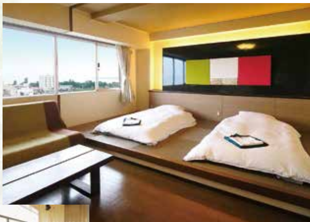
露天風呂付特別室 琵琶湖を一望できる檜(ひのき)の露天風呂付き。 琉球畳のある寝室を有したモダン和室。