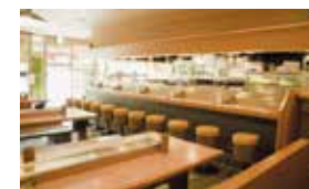
やきとりの名門「秋吉」