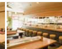
やきとりの名門「秋吉」