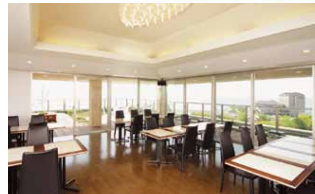
スカイレストラン「ピッコロボスコ シエスタ」